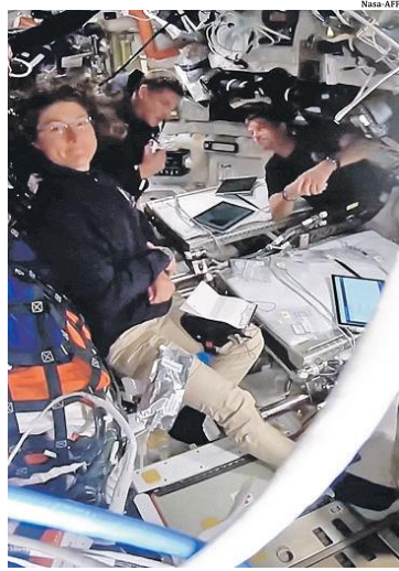
Astronautas foram aonde ninguém jamais esteve

A missão, iniciada na última quarta-feira, entrou no que a Nasa chama de esfera de influência lunar ontem por volta das 04h42 GMT (01h42 de Brasília) para realizar o primeiro voo lunar desde 1972. O período de observação do satélite natural da Terra vai durar cerca de sete horas no total.