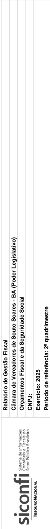
RGF-Anexo 01 | Tabela 1.2 - Trajetória de Retorno ao Limite da Despesa Total com Pessoal