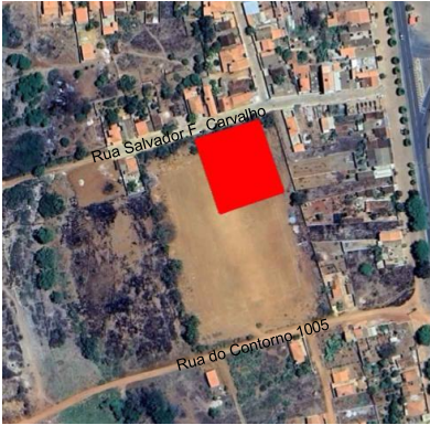
PLANTA DE LOCALIZAÇÃO