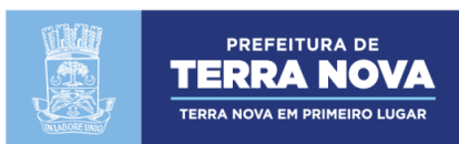
EDER SÃO PEDRO MENEZES PREFEITO DO MUNICÍPIO DE TERRA NOVA/BA

RUA DOUTOR FLAVIO PACHECO PEREIRA, Nº 02, CAÍPE, CEP: 44.270-000, CNPJ: 13.824.511/0001-70 TEL - 75 3238-2061/2062 - FAX – 3238-2098.