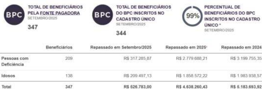
Figura 04: BPC no município de Terra Nova

*Este percentual está sujeito à flutuação devido a procedimentos de exclusão do cadastro de pessoas no âmbito do Cadastro Único, bem como à concessão de novos benefícios do BPC.