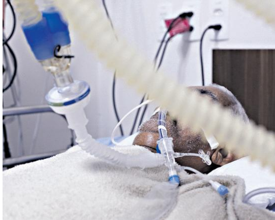
A pandemia do coronavírus revelou um quadro complexo de Síndrome Pós-UTI

Hospital em Lauro atende SUS e é referência em longa permanência