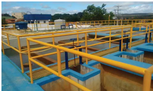
Foto 03 – Vista dos floculadores e decantadores

A Estação de Tratamento de Água que abastece a sede do município e as localidades de Lagoa Grande, Lago do Timóteo e Quaraçu, é do tipo convencional com tratamento completo, com capacidade para tratar 60,0 litros de água por segundo. Atualmente, trata em média 38,1 litros de água por segundo. O sistema produtor opera em média 17 horas por dia e possui em sua estrutura: 2 decantadores com módulos tubulares e 6 filtros rápidos construídos em concreto armado, além de unidades de desinfecção (reservatório de contato). Efetuam-se também o processo de fluoretação. São realizadas diariamente, em laboratório existente na própria unidade operacional, análises físico-químicas com amostragem de 2 em 2 horas.