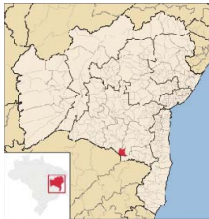
Figura 3 - Localização do município na Bahia e no Brasil