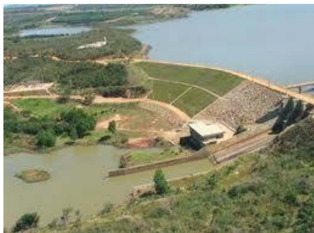
Figura 5 – Lago da Barragem de Machado Mineiro – MG, localizado na Bacia do Rio Pardo