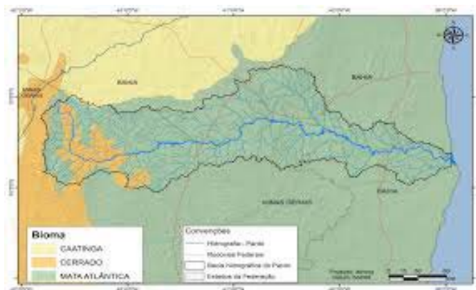
Figura 4 - Bacia hidrográfica