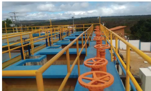
Foto 04 – Vista dos filtros