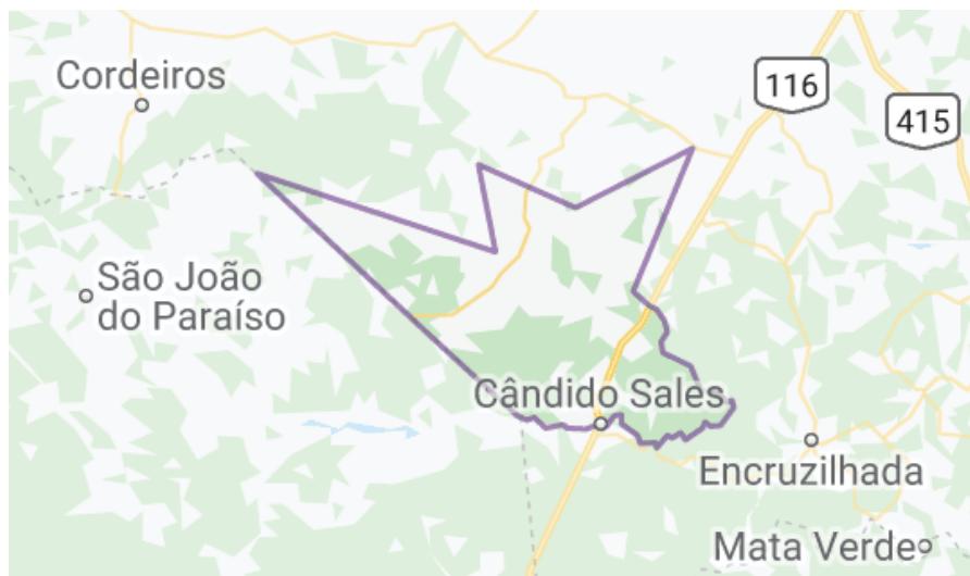
Figura 1 – Limites do município