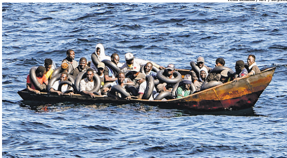
Fethi Belaid / AFP / 28.9.202

O chefe de Governo da Alemanha, Olaf Scholz, destacou na rede X (ex-Twitter) que o acordo é um "ponto de