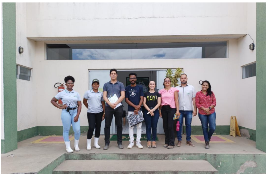
Foto 07: Equipe responsável pela inspeção (SEDAEMA, Consórcio Portal do Sertão e empresa).