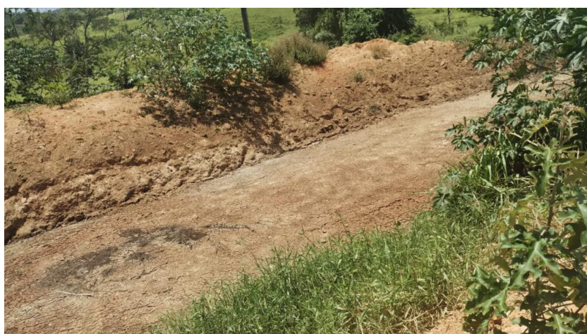
Foto 05: Bacia de contenção esvaziada, somente com lodo em secagem.