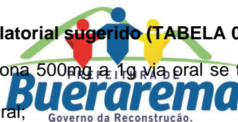
TABELA 03 – TRATAMENTO RECOMENDADO