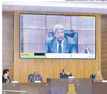
Governador Jerônimo conduziu lançamento do plano

O novo Plano de Atuação Qualificada em Intervenções de Agentes do Estado é resultado de um diálogo permanente com o Governo Federal e de planejamento e ações da Secretaria de Justiça e Direitos Humanos (SIDH), voltadas à transparência, à modernização e ao aprimoramento das forças