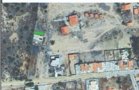
TABELA DE COORDENADAS