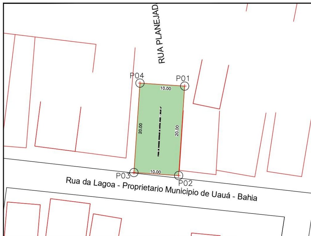
IMAGEM DO TERRENO INVADIDO PELA RUA