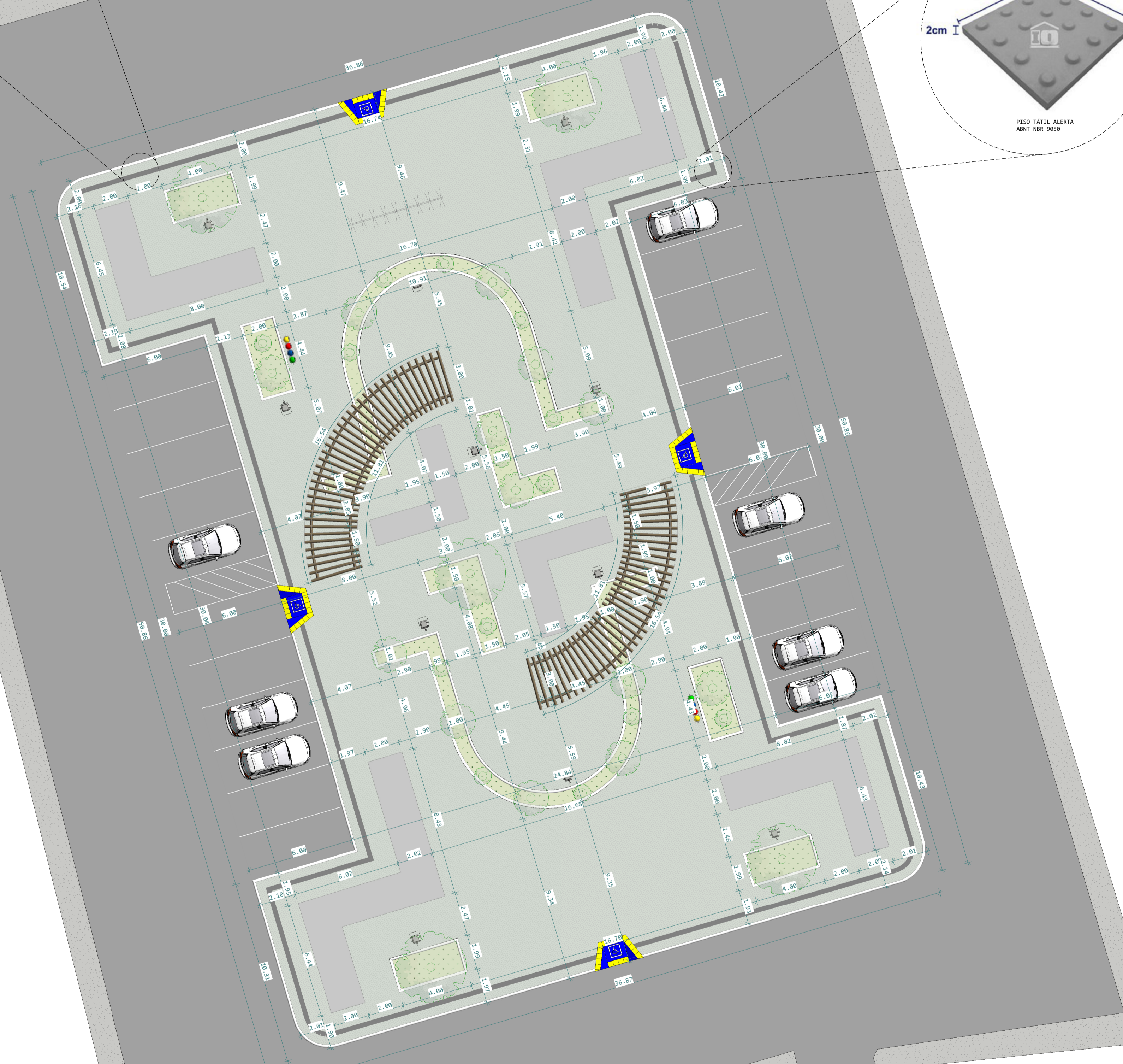
1 PLANTA BAIXA 1 : 150