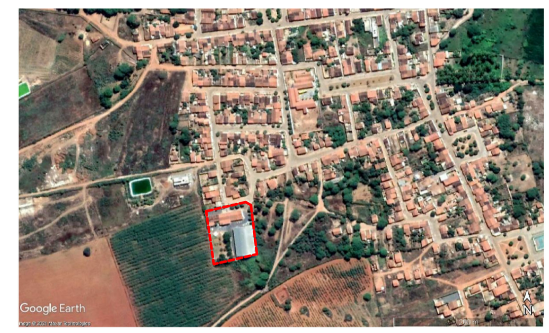
PLANTA GEORREFERENCIADA SEM ESCALA ESCOLA AGNELO C. DOS SANTO