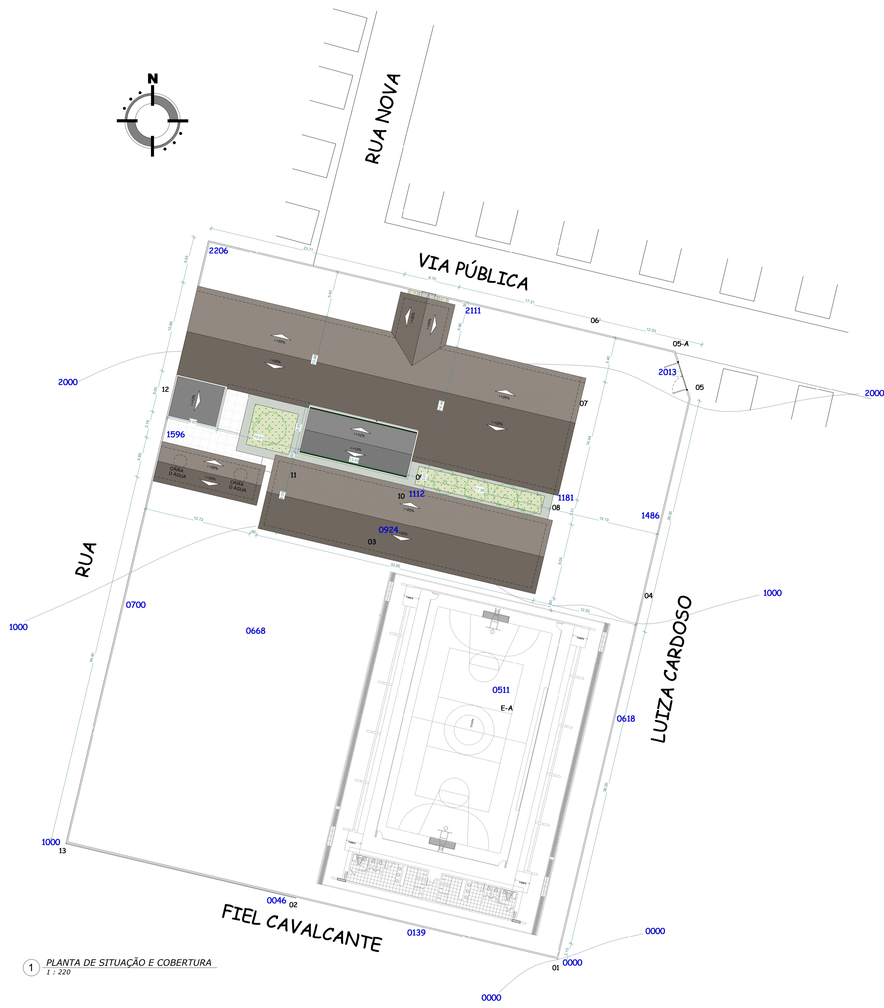
1 PLANTA DE SITUAÇÃO E COBERTURA 1 : 220