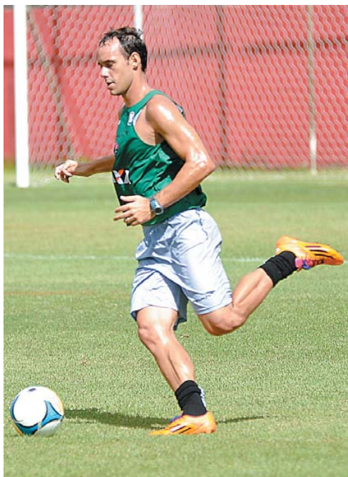
Defendi esteve em Ribeirão Preto para nascimento do filho e volta ao time

"Estava muito ansioso, fiquei três dias em casa, mas só pude ficar algumas horas com ele no dia. Na segunda, às 6h, peguei o voo pra voltar a Salvador", contou. Agora, ele não vê a hora de ter o filho mais perto novamente. E já que fazer gols não é lá o forte do zagueiro, resta apelar para a ajuda dos atacantes na hora de homenagear o mais novo membro da família. "Vou pedir pra fazer aquele dedinho na boca", diz, imitando o gesto que todo mundo quer ver em Curitiba.