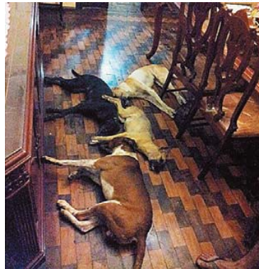
Quatro cachorros não resistem a ataque de abelhas

Para tentar salvar os cães, o músico e o produtor conseguiram levar quatro cachorros para dentro de casa, mas nenhum deles resistiu às picadas das abelhas. “Foi um inferno completo”, ilustra o produtor. A maior parte dos insetos entrou pelo basculante, que fica em frente à sala da casa. “A gente conseguiu fechar a porta