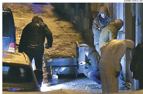
A operação frustrou um ataque terrorista contra prédios da polícia

vido disparos em um prédio de uma rua residencial perto da estação de trem da ex-cidade industrial, que fica entre Liège e a fronteira alemã e a 125 km de Bruxelas. Verviers tem uma ampla população imigrante. De acordo com uma autoridade de contraterrorismo belga citada pela rede de TV americana CNN, o grupo alvo da operação teria sido instruído pelo Estado Islâmico a lançar ataques na Bélgica e na Europa em represália aos ataques aéreos liderados pelos EUA contra a facção radical na Síria e no Iraque. A ofensiva na Bélgica ocorre em meio a uma caçada internacional por possíveis cúmplices dos três terroristas que deixaram 17 mortos na França na semana passada.